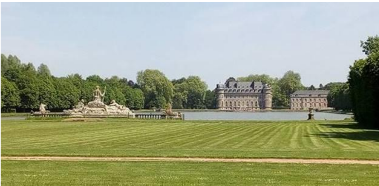
Passage exceptionnel dans le parc du Château de Beloeil !