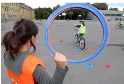
Animations enfants-familles (ici Pro Velo) + stands