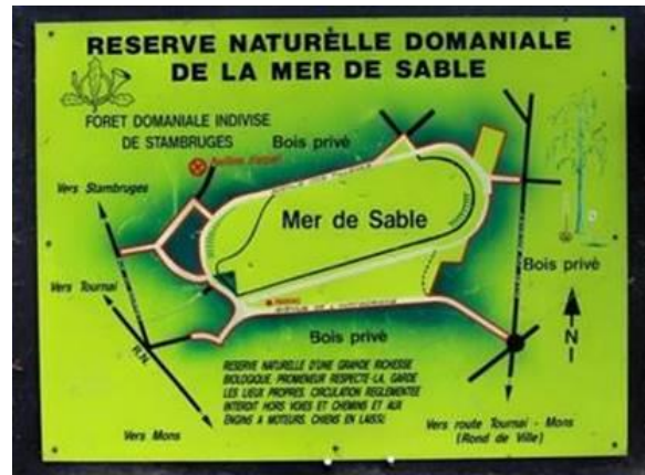
Stands et animations à la Mer de Sable à Stamburges